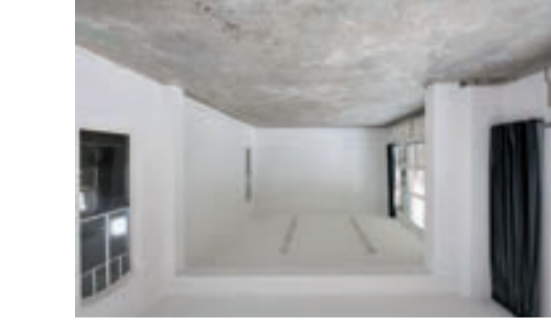
LEO XIII / gastatelier Leo XIII / gastatelier is een atelier gelegen in een voor- midag schoolgebouw uit 1908 aan de Leo XIII straat 50 in Tilburg. Het is een monumentale, lichte ruimte ter grootte van twee kassakablen. In het gebouw bevinden zich woningen, ateliers en bedrijfsruimtes voor kunstbe- zoekers. Het atelier bevindt zich op korte afstand van De Poort en het Textielmuseum, beiden centra voor hedendaagse kunst en onderzoek.

Kunstenaar en/of woninger kunnen hier als artist- in- residence werken en wonen binnen een periode van drie maanden. Justit die geconcentreerde periode, de fysieke kwaliteit van de werkplek en de culturele omgeving vormen de uitdaging om een onderzoekstrategie of project aan te gaan, hergeen kan leiden tot verdieping of verbe- tering van de eigen ontwikkeling.