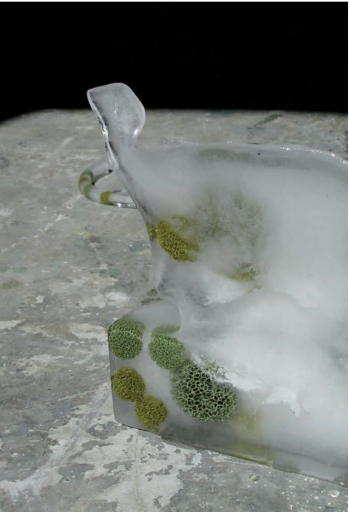
LEO XIII / gastatelier – Tilburg Nathalie Bruys / werkperiode: maart – mei 2010