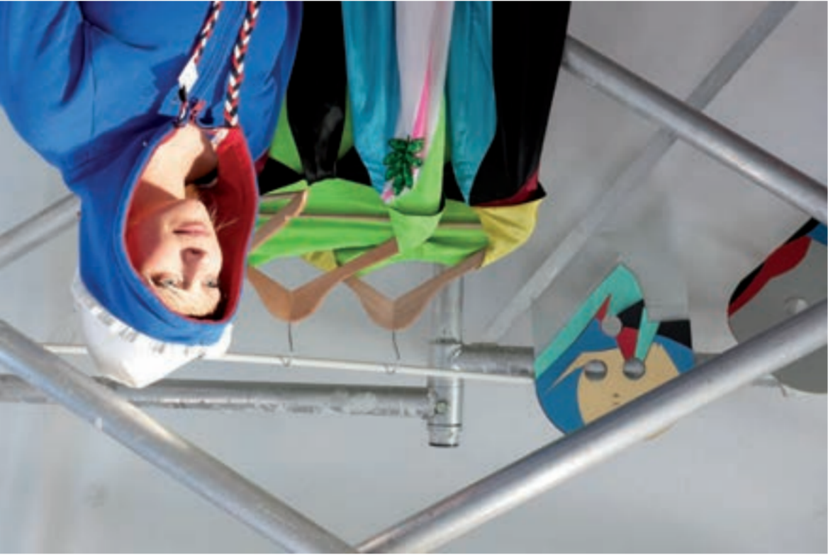
LEO XIII / gastatelier – Tilburg Nathalie Bruys / werkperiode: maart – mei 2010

Colton Nathalie Bruys / werkperiode: maart – mei 2010 Leen Bedaux fotografie – Peter Cox pag. IV, V, VI, VII poster – Up in the ear / Arrangement fotografie: Nathalie Bruys oplage – 500 papier – Montana, 115 g/m 2 ontwerp – Kees Siep en Vera Bekema / Nathalie Bruys pag. VII Up in the ear / Arrangement )