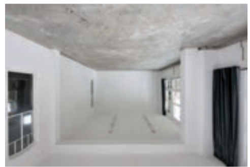
LEO XIII / gastatelier

voor hedenbaggage kunst en onderzoek. atland van De Pont en het Textielmuseum, bieden centra nars/vormgevers. Het atelier bevindt zich op korte grootte van twee kassakalen, in het gebouw bevinden in Tilburg. Het is een monumentale, lichte ruimte ter maling schoolgebouw uit 1988 aan de Leo XIII straat 90