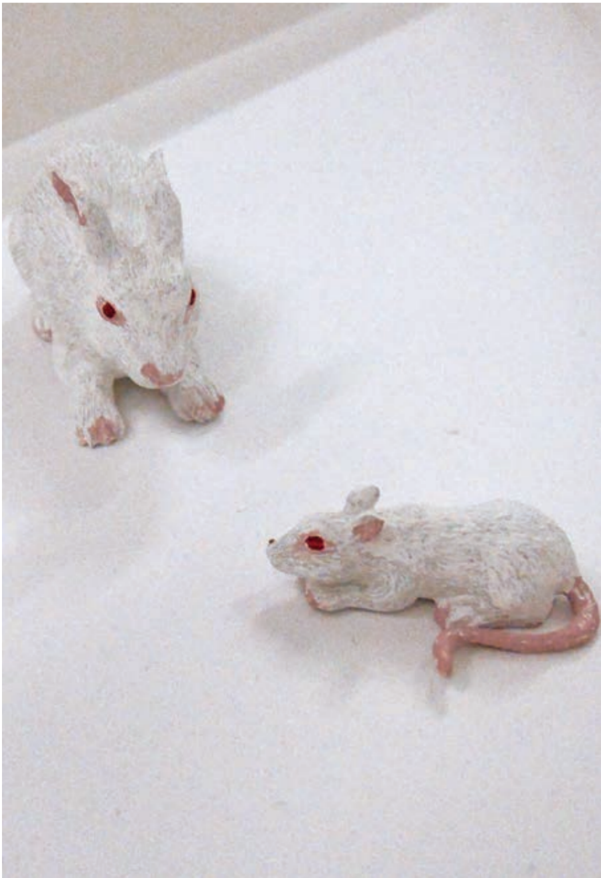
LEO XIII / gastatelier – Tilburg Evelyne Montens / werkperiode: december 2009 – februari 2010