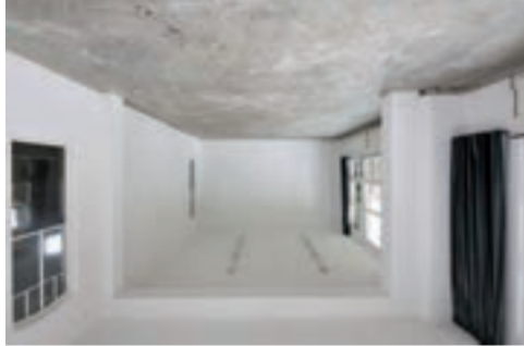
LEO XIII / gastatelier is een atelier gelegen in een vrolijk schoolgebouw uit 1988 aan de Leo XIII straat 90 in Tilburg. Het is een monumentale, richte ruimte ter grootte van twee klaslokalen. In het gebouw bevinden zich woonruimten, ateliers en bedrijfsruimtes voor kunstenaars/vermogens. Het atelier bevindt zich op korte afstand van De Pont en het Textielmuseum, beiden centraal van heden afgevoerd kunst en onderzoek.

Kunstenaars en/of vormgevers kunnen hier als artists-in-residence werken en wonen binnen een periode van drie maanden. Just als de gecentreerde periode, de fysieke kwaliteit van de werkplek en de culturele omgeving vormen de uitdaging om een onderzoekstraject of project ding van de eigen ontwikkeling.