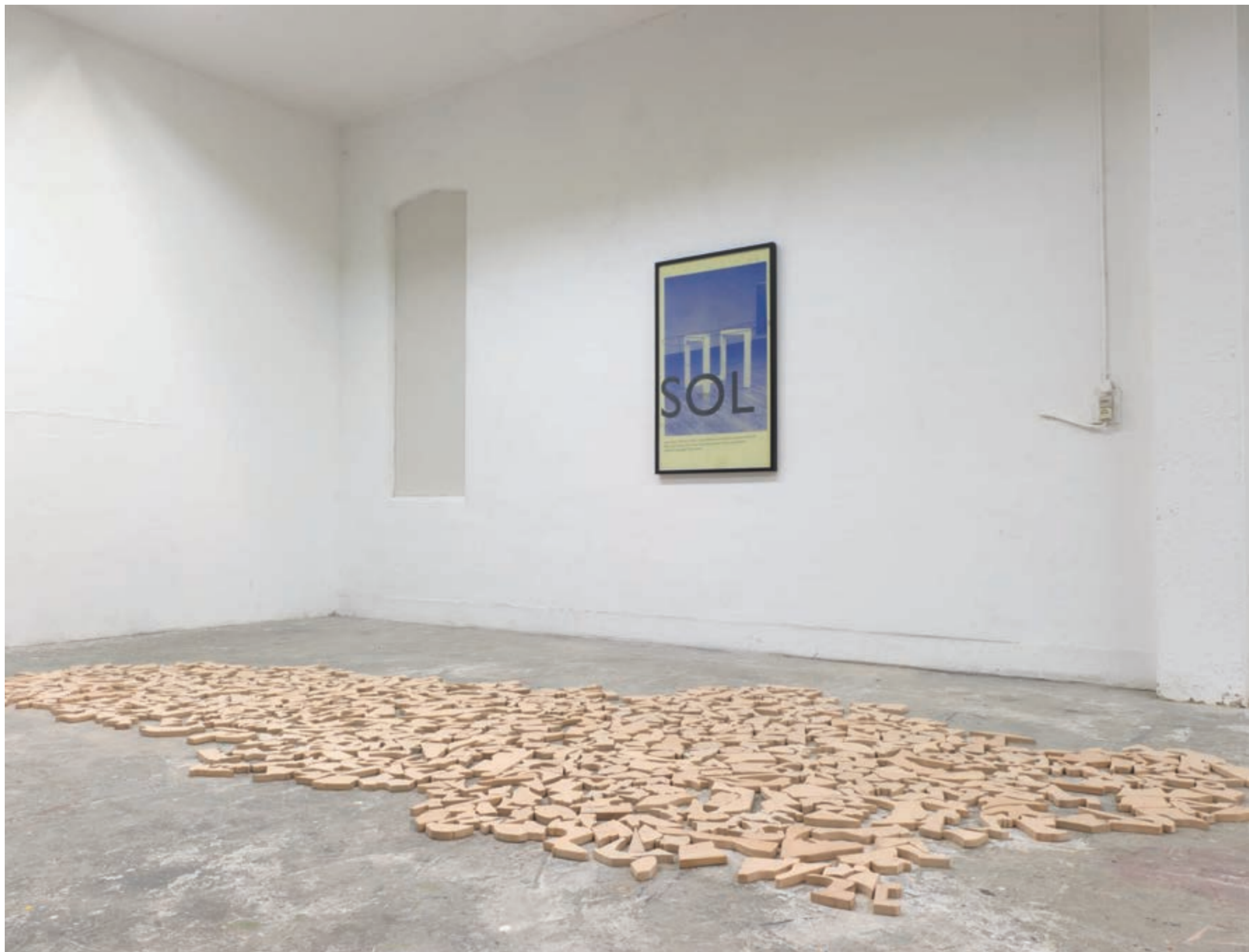
EEN IDIOSYNCRATISCHE MACHINE, 2010-2011 BEUKENHOUT